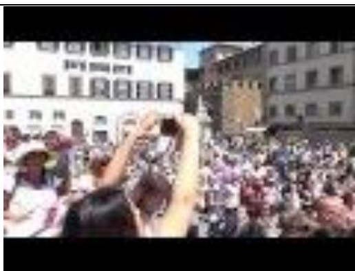
Video manifestación Italia https://youtu.be/-8Ckf_WKEzI

Pronto tendremos que luchar en muchos frentes en la medida que el gobierno y los principales medios de comunicación continúen suprimiendo el progreso de este importante movimiento. Sin embargo, la gente continúa levantándose y está resuelta a resistir el peor fraude médico de la historia.