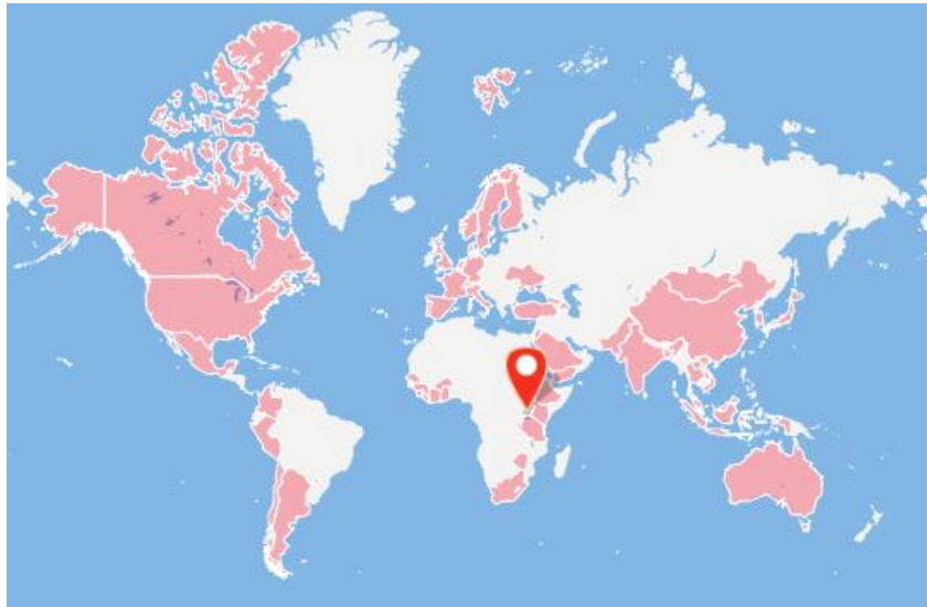
En la imagen observamos los países que forman parte de la GHSA

Nos encontramos a nivel internacional con una campaña a favor de la obligación de las vacunas, organizada por la Global Health Security Agenda GHSA.