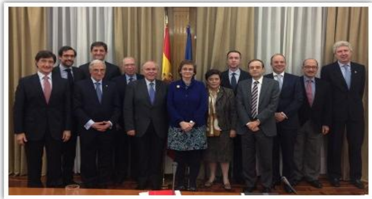
Foto de familia del Comité de Bioética de España