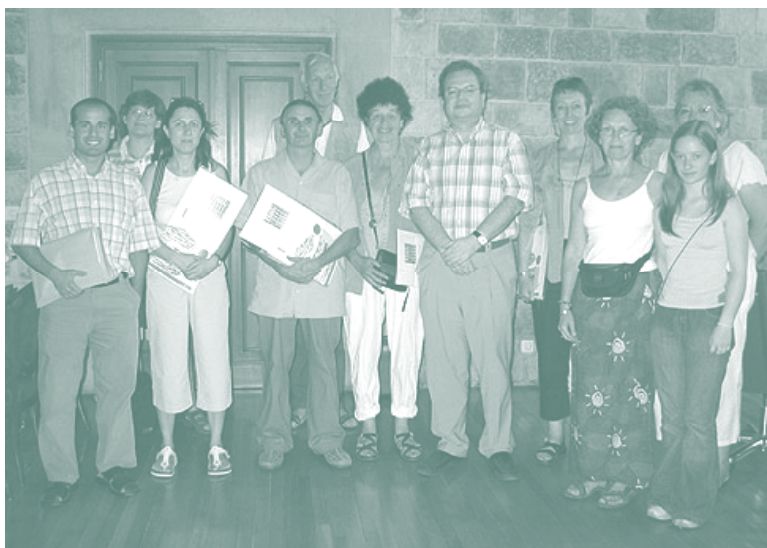
Recepción en el Ayuntamiento de Girona